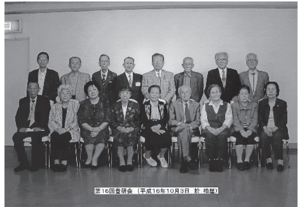
第2図 第16回登研会 集合写真 2004(平成16)年撮影

「過ぎし日は」は、それぞれの多様性がありました。15歳くらいで勤めた人たちは川崎北部に住んでいる人々が圧倒的に多く、その人たちが言うには、ほかの工場などに動員されるのと