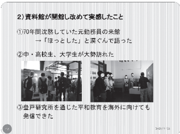
第6図 講演会当日のパワーポイント資料より

資料館が開館して10年になりました。この間、大変不思議なことがいろいろ起こりました。登戸研究所に勤めた人で登研会に入らなかった人、そしてまったくその口を開かなかった人が大勢いました。その方々が資料館ができてから、資料館を訪れて来るんです。そして言う事は、ここ(第6図①)にも書いてある「ほっとした」と語るんですね。これは皆さん共通の言葉でした。そして、この①に書いてあるその代表的な例は、70年間沈黙していた元勤務員が来館した時でした。この方は第三科という、登戸研究所の偽札を作る場所に、その紙を抄く場所に15歳で勤めた。これは1943年の年でした。ですから戦争が終わる直前。そして2年間頑張って勤めましたが、敗戦にな