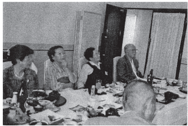
第3図 第15回 登研会のようす 2003(平成15)年撮影