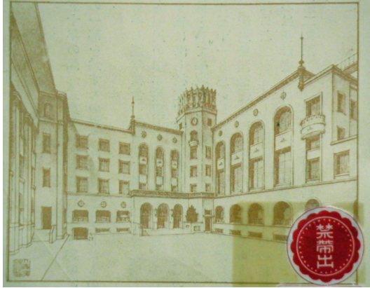
図 1: 第 2 期工事完成後の図書館全景

新図書館の総坪数は 480 坪、施設は 1 階事務室、閲覧室、2 階大閲覧室、3 階大ホールにして会議室、地下 1 階書庫と大学院付属研究室である。なお、第 2 期工事は概要が示されていたが実現をみるに至らず、完成すれば 4 倍の規模を誇る幻の図書館であった。(図 1)